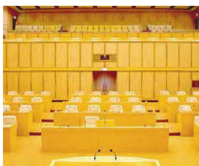
◆ 第3回定例会開会日 …9月1日（金）（予定）